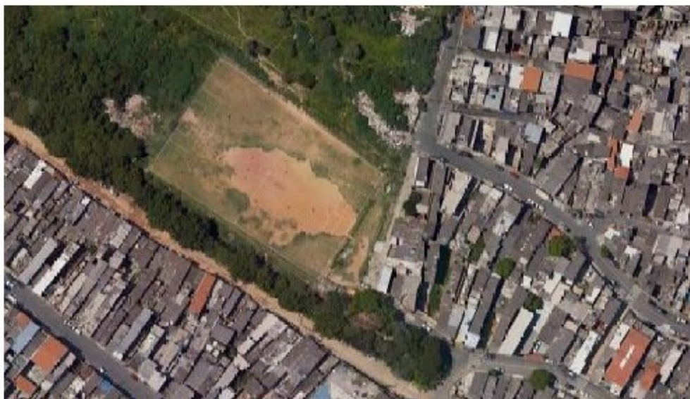
Campo Maria Beatriz.

O trecho localiza-se em uma região com urbanização consolidada.