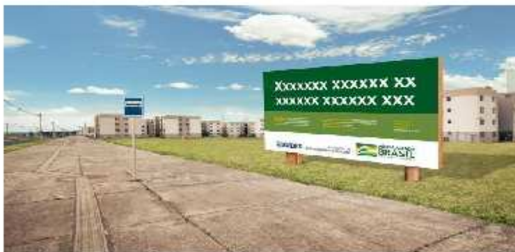
Imagem 1 – Modelo Placa de Obra

( https://www.caixa.gov.br/Downloads/gestao-urbana-manual-visual-placas-adesivos-obras/Manual-Placa-de-Obras.pdf ).