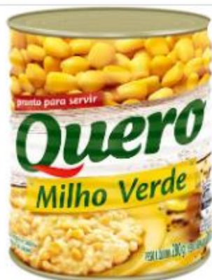
Milho Verde Quero Lata 200 G