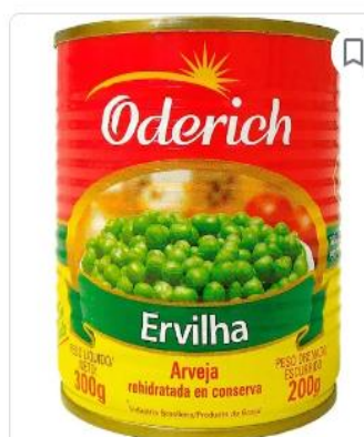
Ervilha Em Conserva Oderich 200g