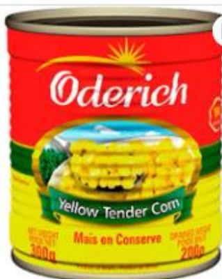
Milho Verde Oderich 200g