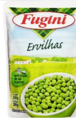
Ervilha Fugini 200g