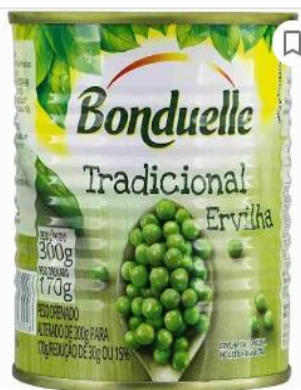
Ervilha Bonduelle Tradicional Em Conserva Lata 200g