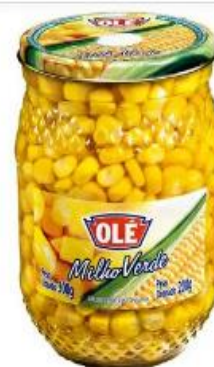
Milho Verde Ole Vd 200g - Supermercado Travenzoli