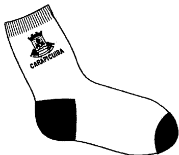
ilustração do produto