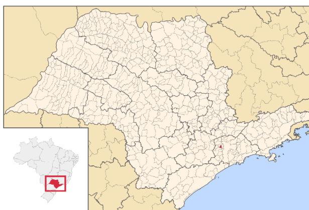
Figura 2 - Localização de Carapicuíba em São Paulo