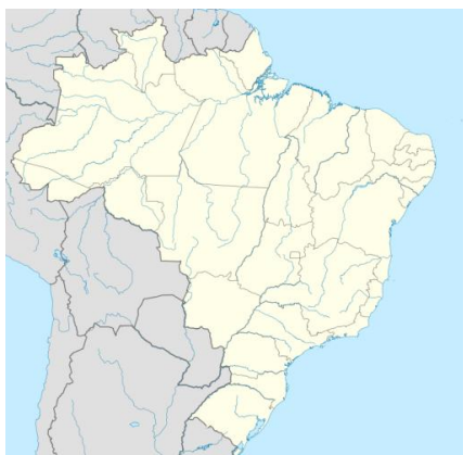
Figura 1 - Localização de Carapicuíba no Brasil