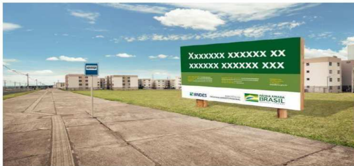
Imagem 1 – Modelo Placa de Obra

É obrigatória, a instalação de uma placa, em chapas galvanizadas, para identificação da obra, de 3 metros de altura por 8 metros de comprimento, totalizando dezoito metros quadrados. Conforme estabelecidos no site da Caixa ( https://www.caixa.gov.br/Downloads/gestao-urbana-manual-visual-placas-adesivos-obras/Manual-Placa-de-Obras.pdf ).