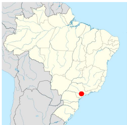
Figura 1 - Localização de Carapicuíba no Brasil